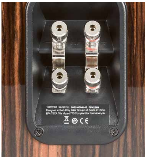
Ein rhodiniertes Bi-Wiring-Terminal sowie eine strömungsoptimierte Bassreflexöffnung dominieren die Rückseite der Signature.

Dabei macht die B&W stets auch in exzellenter Weise die Qualität der antreibenden Elektronik hörbar – und wächst daran nicht zu knapp. Der neue Vollverstärker i9 XR von Cyrus erwies sich beispielsweise als ebenso hervorragender Spielkamerad wie ein Audionet SAM 20 SE. Die Britin ist weder aufstellungs- noch impedanzkritisch und ließ sich spontan und allürenfrei zu klanglichen Höchstleistungen animieren, auch mit Van Halen im „Party“-Modus.